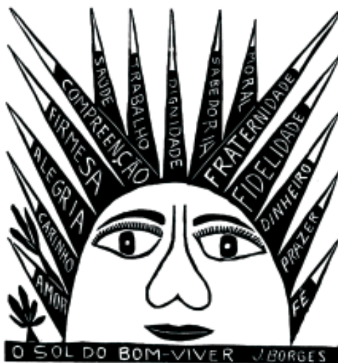
Na gravura de J. Borges (Pernambuco), figuras solitárias se destacam no branco

A técnica surgiu na China há milênios, mas há exatos cem anos chegou ao Nordeste brasileiro, onde ganhou espaço e personalidade própria unindo-se à literatura de cordel para retratar um campo em que a fotografia não podia penetrar: o imaginário sertanejo.