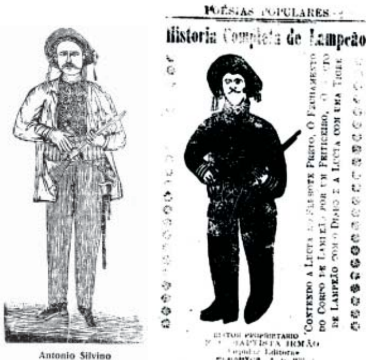
Xilogravura presente no cordel editado em 1907, em

Este mesmo estilo de gravura serviria de exemplo para os fotógrafos do Cinema Novo Brasileiro que tentavam uma fotografia sem tons intermediários, como aconteceu nos filmes Aruanda, Deus e o Diabo na