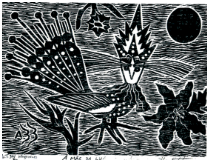
A mãe da lua, de Abraão Batista (Juazeiro do Norte), prima pela riqueza de detalhes